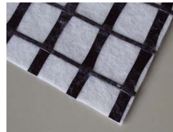
Bitutex® Composite™ vlies / non woven

Voor Bitutex® uit glas en polyester in alle variaties en treksterkten vanaf 30 tot 200 kN/m is de CE-markering van toepassing. De benodigde technische documenten zijn opvraagbaar.