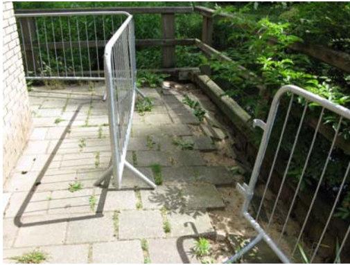
Schade: verzakking voetpad door wegspoelen zand