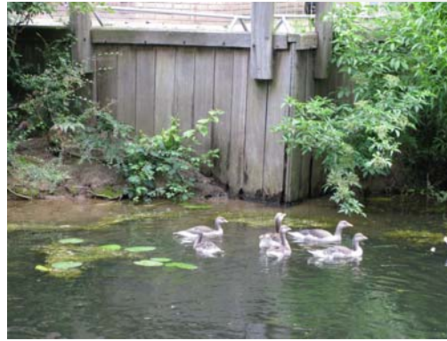
Oorzaak: weggroten houten damwand